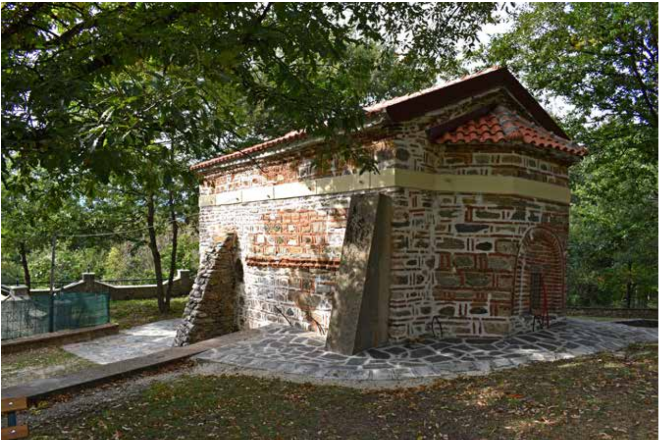
Сл. 2 Поглед од југо-исток

ред тули се поставуваат две вертикални тули во спојниците меѓу камењата 14 . Отстапки од ова има, имено, на северната фасада каде што се делумно дуплирани хоризонталните редови на тули, и на источната фасада каде што, на места, меѓу спојниците на камењата е поставувана само по една вертикална тула 15 . Сидовите во вертикала завршуваат со двојна запчеста лента каква што има на јужниот ѕид и која него го дели на два дела. Во горниот дел на јужниот ѕид е изведен и декоративен фриз составен од наизменично поставени хоризонтални и вертикални тули. Над овој фриз се јавува и украсна лента ограничена со два хоризонтални реда на тули исполнета со кршени камења. Овој фриз се движи долж трите фасадни ѕидови на црквата, со тоа што на источната фасада на места е дуплирана, а на места недостига, а на северната фасада е двојно поширока со ширина од 0.3-