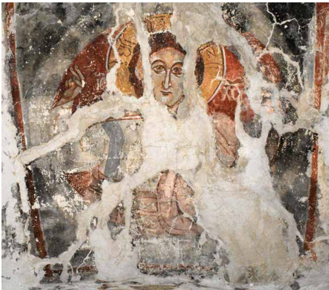
Сл. 6 Христос Емануил

непрестајно горат со оган, тие се најблиску до Бога, со нивната моќ ја уништуваат и темнината 38 . Како најблиску до Бога се спомнуваат и во Откровението на Јован (Откр 4:8) 39 . Покрај горе наведениот пример од Св. Ѓорѓи во с. Годивје, кој одговара хронолошки, серафими на највисоките зони во храмовиот ентериер се претставувале уште во претходните векови како на пример во: катедралата во Чефалу – Сицилија (1131 – 1148) 40 и Св. Софија во Трабзон (околу 1250) 41 . Помеѓу серафимите се насликани и декоративни мотиви со различни елементи, некои се медалјони со крстови, додека други се претстави на ѕвезди обиколени со бели точки. Сите декоративни елементи се насликани со бела боја. На северниот ѕид се прет-