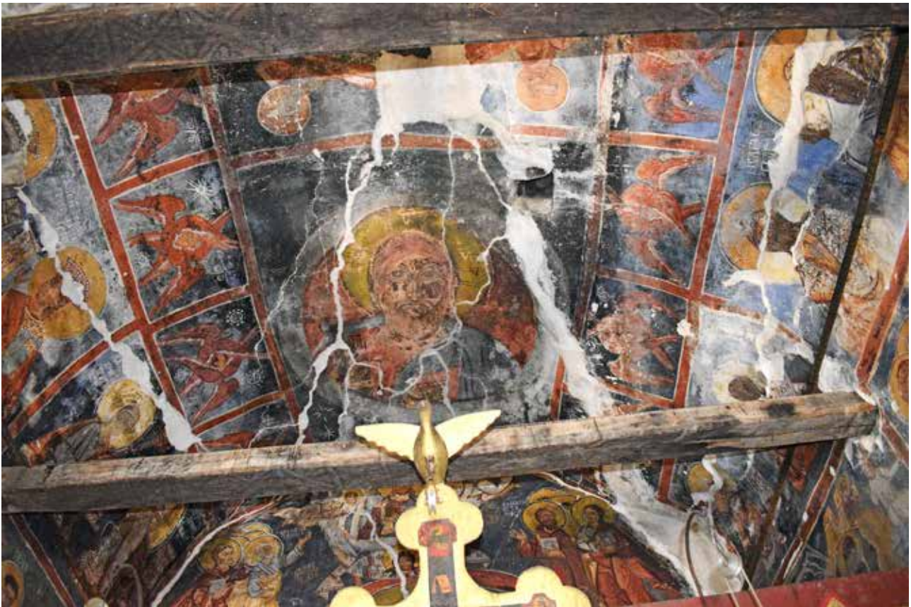
Сл.7 Источен дел на сводот

во втората зона северно и јужно од апсидата, северно е Архангелот Гаврил: ΑΡΧΑΓΓΕΛ ΓΑΒΡΙΗΛ , јужно е Богородица: ΜΡ ΘΥ . Раѓањето на Христос се наоѓа на јужниот ѕид, претставена е и епизодата капењето на малечкиот Христос, што е честа појава во византиската уметност и разговорот на ангелот со пастирот, кога му ја соопштува веста за Христовото раѓање 45 . Сретението, со натпис: ΣΙΜΕΟΝΟΒΟ ΠΡΙΕΤΙΕ е насликано на јужниот ѕид. На северниот ѕид се композициите: Мироносници на гробот (се читаат натписи: ΓΕΝΙ ΜΙΡΟΝΟΣΙΝΙ и ΠΟΒΟΣΨΗΧΪΕΤΕ ΖΪΒΑΓΟ ΣΪΜΡΤΡΪΜΙ ) 46 и Симнување во Адот. Вознесението Христово 47 под кое има претстава на Мандалионот или Убрус се наоѓа на источниот тимпанон над апсидата. Наша претпоставка е дека сводните површини и нај-