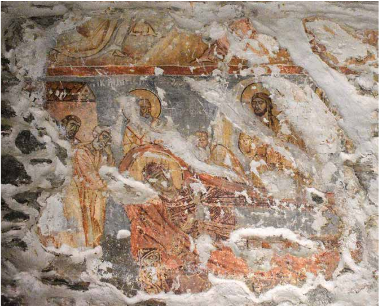
Сл. 4 Успение на Богородица и Преображение

верниот и јужниот ѕид, при што јужната контрафора делумно го покрила единставениот прозорец од наосот на црквата. Во поново време тој прозорец е повторно отворен. Мали поправки има и на делови на фасадите и на покривот 18 . Слични вакви контрафори има и на црквата Св. Ѓорѓи во кичевското село Вранештица, подигната на крајот на XV век 19 .