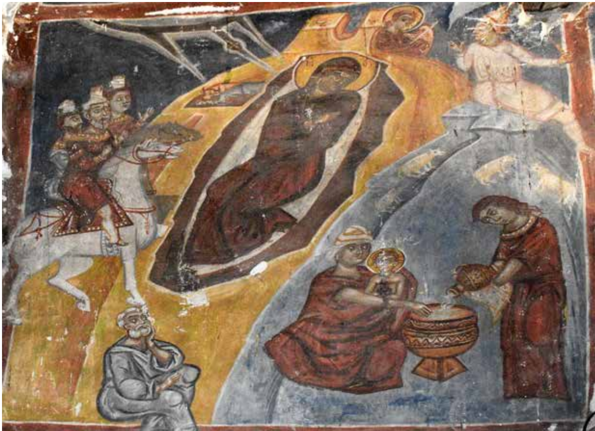
Сл. 8 Раѓање на Исус

ΟΥΡΑΝΟΥ 49 . На десната се претставени: св. Јован Златоуст (СТΙ ΙΩΒΑΝ), на свитокот се чита: ΕΞΑΙΡΕΤΩΣ ΤΗΣ ΠΑΝΑΓΙΑΣ ΑΧΡΑΝΤΟΥ Η ΕΝΔΟΞΟΥ, ΔΕΣΠΟΙΝΗΣ ΗΜΩΝ 50 , и св. Атанасиј (СТΙ ΑΘΑΝΝΑΣΙΕ), на свитокот се чита: ΤΑ ΣΑ ΕΚ ΤΩΝ ΣΩΝ ΣΟΙ ΠΡΟΣΦΕΡΟΝΤΕΣ ΚΑΤΑ ΠΑΝΤΑ ΚΑΙ ΔΙΑ ΠΑΝΔΑ ΣΕ ΥΜΝΟΥΜΕΝ 51 . Сите свети отци/архијереи се сигнирани без епитетите. Тука е важно да се напомене дека св. Григориј е насликан со капа што не е карактеристично за овој светител. Во близина на нишата која служела како протезис е насликан архиѓаконот Стефан (СТΙ ΣΤΕΦΑΝ), грубо пресликан во XIX век, во едната рака држи долг свиток, а во другата кадилница. На северниот ѕид веднаш до нишата е претставена фигура сигнирана како св. Петар (СТΙ ΠΕΤΡЪ) облечен во фелон, хитон и омофор декориран со крстови, со рацете е претставен во