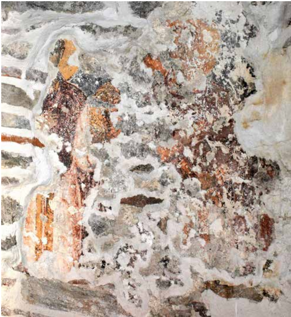
Сл. 5 Св. Бесребреници Кузман и Дамјан