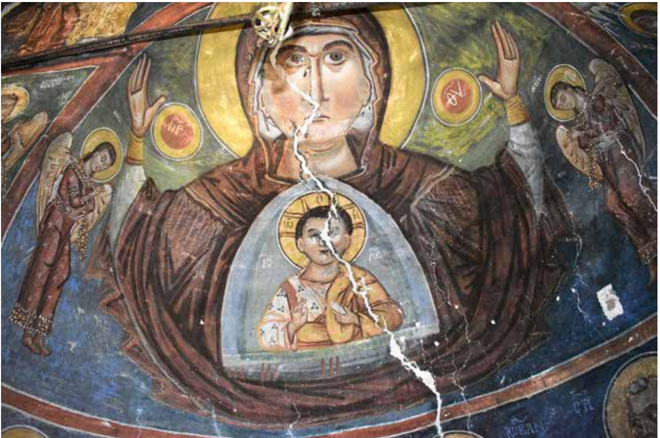
Сл. 10 Богородица со Христос во конхата

ниот ѕид има претстава на Деисисот, во кој доминира претставата на Христос облечен во дивитсион и лорос (иако е лорос, се забележуваат грубо насликани крстови кои најверојатно потекнуваат од XIX век) со затворена круна - камелавкион на главата. Во раката држи отворена книга, на која на едната страна на словенски е испишано ПРІ ПЛЯГОСЛОВЕНИ ОД ОНА МОЕГО, додека на другата страна која е оштетена се чита: ІАКОВІНА СЛѢХУВА. Покрај оштетеноста на едната страна, можеме да заклучиме дека е испишан текст од евангелието според Матеј, испишан е делот Матеј 25: 34 56 . Во композицијата се инкорпорирани и други натписи, помеѓу нив и натпис кај претставата на св. Јован Крстител (СТІ ЈОВАН), напишан на словенски јазик што е обраќање кон Христос - СЛИШАИ МАТЕР СВОЮ. На долгиот натпис на Богородица (MP ΘΥ) се чита: ТИ БО МОНОЛЮТИ СЕ ЗА ХРИСТИАНИ ПОМНАХЛА ВЛАДИКО. 57 Слично вака конципиран Деисис има и во црквата Св. Богородица во манастирот Матка, кај Скопје, датирана во 1496/97 година, на оваа композиција Христос носи царски инсигнии, а