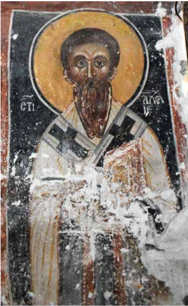
Сл. 11 Св. Ахил Лариски

стилот на сликање и одредени детали, втората фаза на фрескоживопис ја датираме во крајот на XV или првите децении на XVI век. Важно е да се напомене дека фрескоживописот во црквата Св. Петка во с. Брајчино, потекнува од периодот 1486 – 1493 година, и е дело на анонимен зограф од Костур 59 . Стилот, иконографијата и програмата во овие две цркви се сосема различни, притоа во црквата во Грнчари најголем дел од натписите се на словенски јазик, додека во Брајчино сите натписи се на грчки. Тука треба повторно да се напомене дека според нас, фрескоживописот трпел измени т.е. бил пресликан во XIX век. Оваа преслика посебно е евидентна на претставата на Благовештението, Вознесението, сводните површини, Службата на архијереите и претставата на архиѓаконот Стефан. Ова говори дека црквата