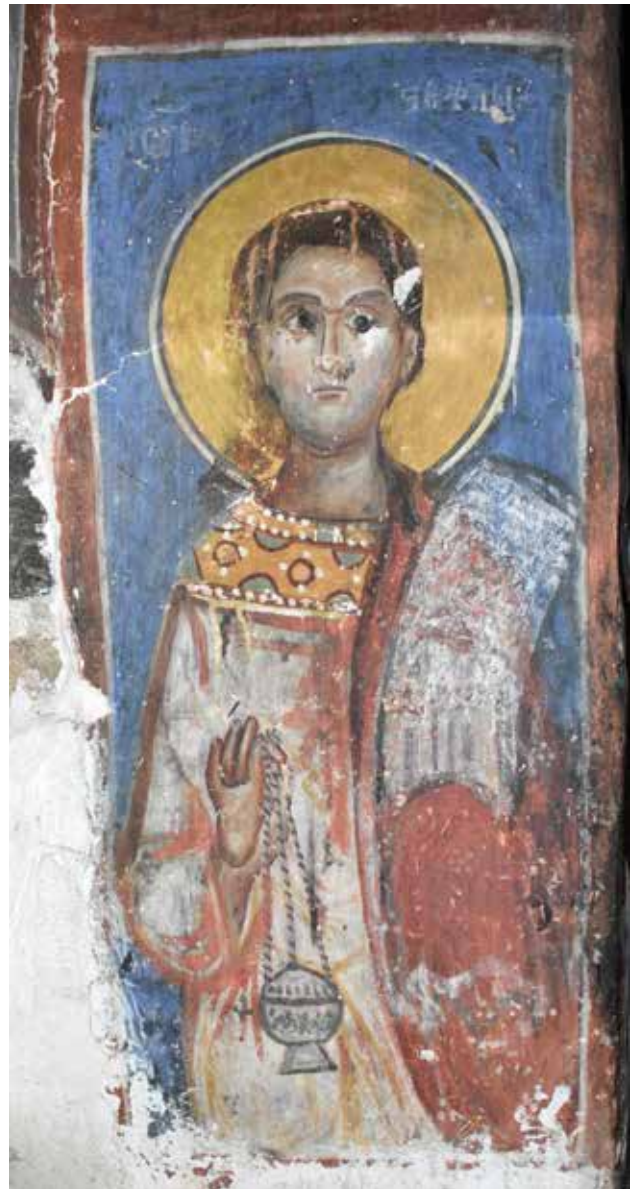
Сл. 12 Св. Стефан

низ историјата била почитувана, а секако пресликата е направена кога се доградени потпорните сидови/контрафори, и најверојатно овој зафат се должи на оштетувањата кои црквата ги претрпела во текот на историјата. Несомнено, најмногу е посветено внимание на претставите во првата зона. Оваа наша претпоставка најмногу е видлива на претставата на патронот на храмот св. Никола, посебно е обрнато внимание на архијерската одежда, и ликот. Тенот на ликот е насликан со потмен колорит, додека брчките и образите се нагласени со светли бои, со темни сенки, сликарот се обидел да ја долови третата димензија, и изгледа прилично грубо. Тоа што може да се забележи е дека авторот не бил добар познавач на пропорциите, па така главата на св. Никола е несвојствено голема за неговото тело. Зголемување на пропорциите има и на претстава на Христос во Деисисот, за што има и други примери, ваквото зголемување на пропорциите покрај примерот од оваа црква, и