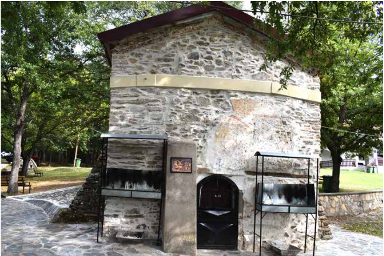
Сл.1 Поглед од запад

сетувале огромен број на жители од соседните села 7 .