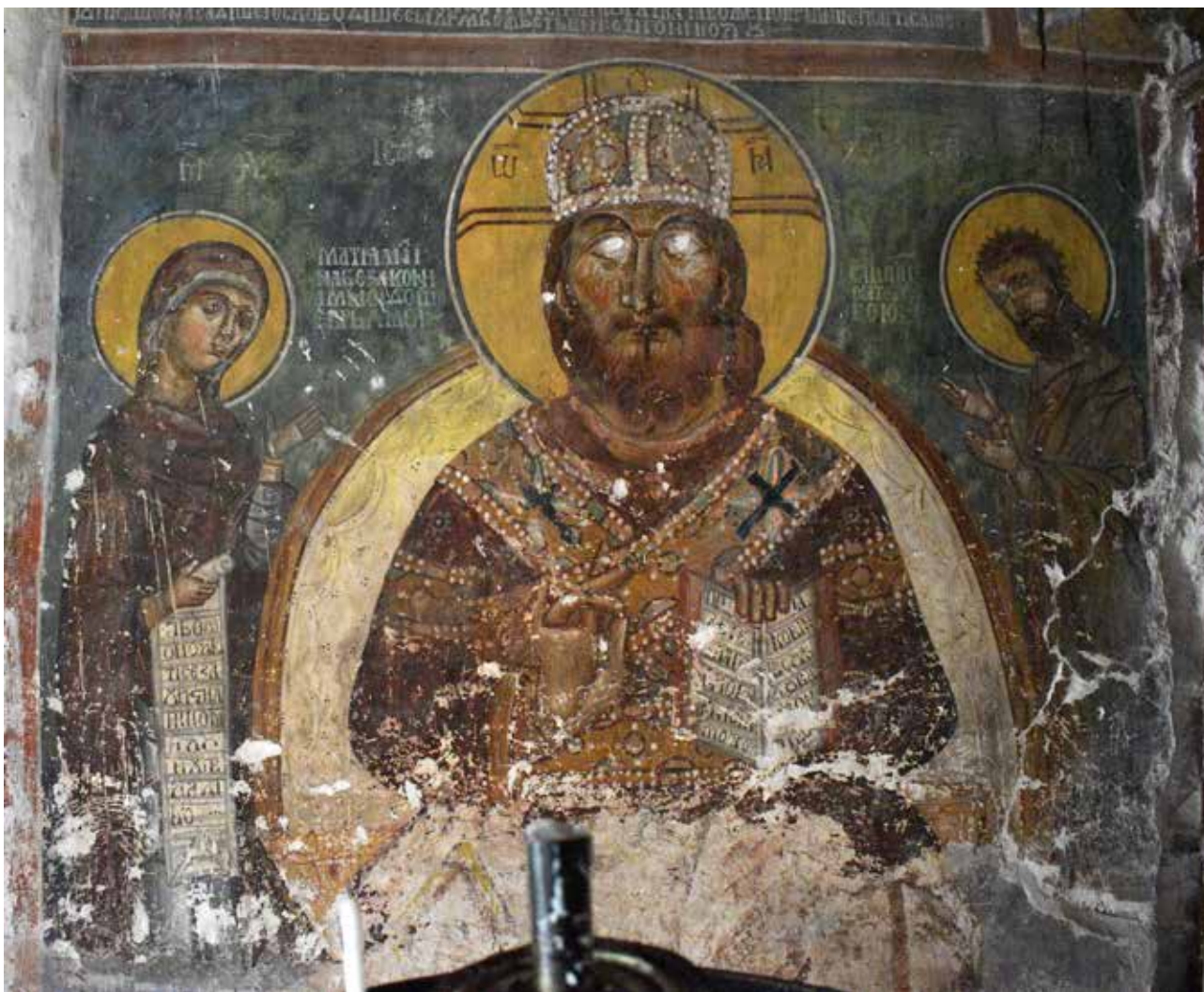
Сл. 13 Деисис

примерот од манастирот Матка, што го спомнавме погоре во трудот, има и во црквите: Вознесение (Св. Спас) во с. Лескоец (1461/62) 60 и Св. Ѓорѓи во с. Вранештица (1481 – 1512) 61 . Сликариот ракопис на зографот се карактеризира со силен цртеж и силни сенки со цел да добие тродимензионала претстава, евидентно на сите претстави, авторот се труди вешто да ги претстави одеждите иако самите фигури немаат никаква елеганција. Авторот покрај одеждата на св. Никола, за што спомнавме и погоре, посветил и големо внимание на одеждите на Светите отци во рамки на композицијата Служба на архијереите. Сите четворица учесници се облечени во полиставриони, врз кои носат омофори, а евидентно е дека оваа композиција била делумно пресликана во XIX век.