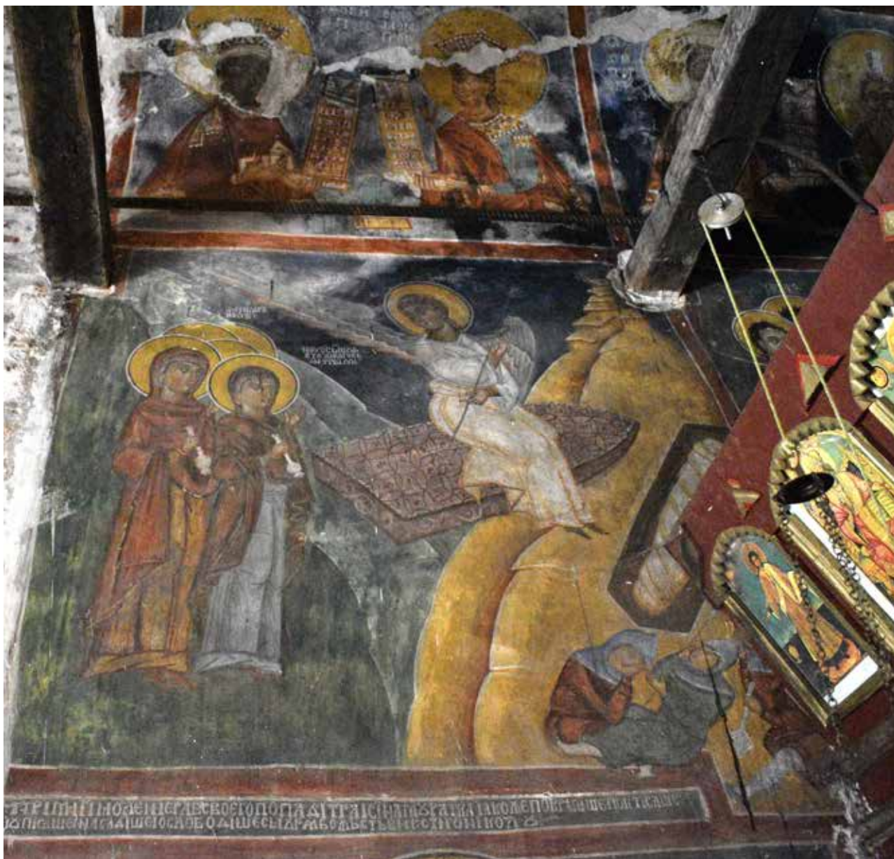
Сл. 9 Мироносници на гробот

култ е многу почитуван во Преспанскиот регион, овој портрет е веќе познат во научната јавност 54 . Светителот е претставен фронтално, облечен во хитон, химатион и омофор декориран со крстови, во едната рака држи книга/евангелие, а со другата благословува. Култот на св. Ахил Лариски, кој учествувал на Соборот во Никеја (325 г.), во Преспа и Македонија започнал да се шири во X век. Поточно по освојувањето на Лариса во 985 – 986 година од страна на царот Самоил, кога ги пренел моштите на светителот во Преспа, со цел да го зајакне државниот и црковниот легитими-